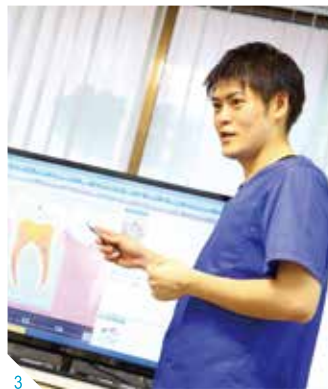
1.「患者とのコミュニケーションの時間を大切に」と、元気あふれる対応を目指す(西山歯科医院)スタッフ 2.滅菌・消毒の徹底を目指した院内。バリアフリー設計で、気軽に入りやすい空間づくりにこだわっている 3.大型の画面に説明用の資料ツールを映し出し、よりわかりやすい説明を心がけている